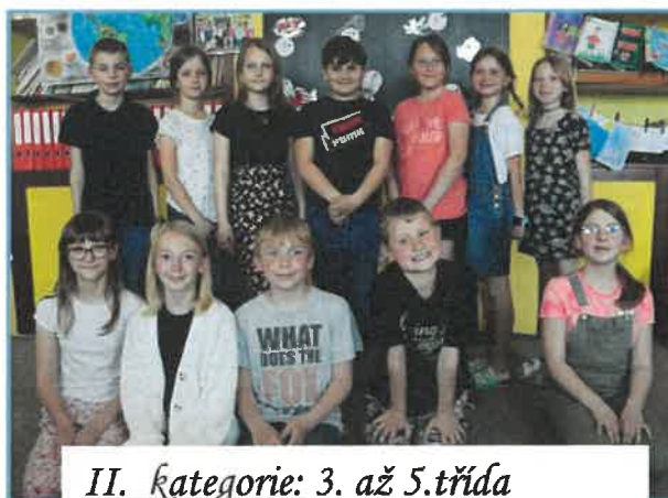
II. kategorie: 3. až 5. třída