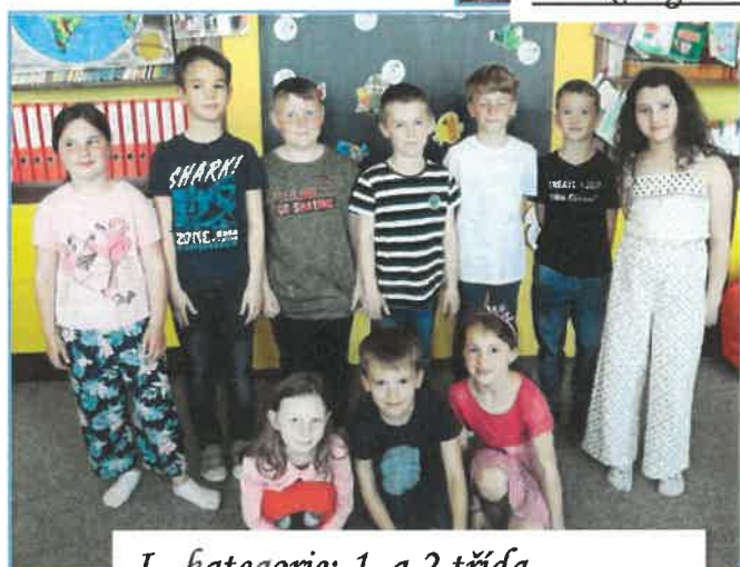
I. kategorie: 1. a 2. třída