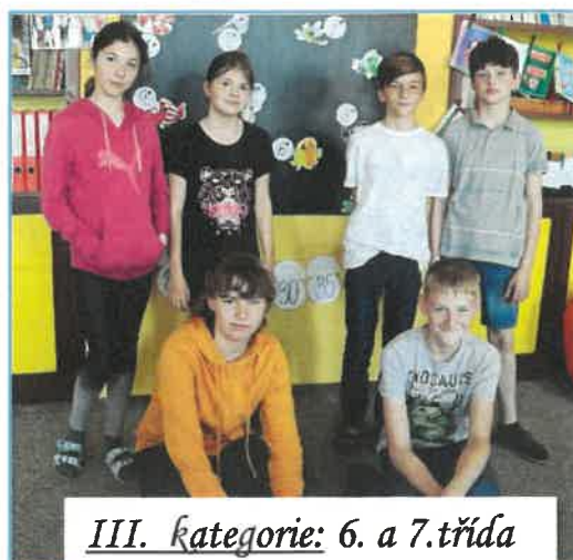
III. kategorie: 6. a 7. třída